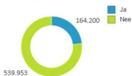
Tikt aan op thuistaal niet-Nederlands