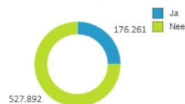
Tikt aan op buurt