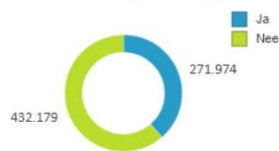
Tikt aan op schooltoelage